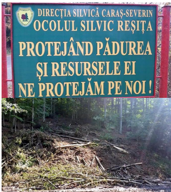
Tăieri de arbori în rezervația naturală Comarnic

În ultimii doi ani GEC Nera a monitorizat tăierile de arbori care au loc și în momentul de față în rezervația naturală Comarnic din interiorul Parcului Semenic - Cheile Carașului, mai concret în unitățile amenajistice (UA) - 26 și 27 din unitatea de producție (UP) - X Comarnic. Rezultatul monitorizărilor a fost trimis instituțiilor direct responsabile.