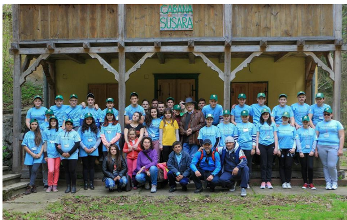
Corpul de voluntari al GEC Nera

În cadrul proiectului este vizată implicarea de către GEC Nera a cetățenilor în monitorizarea politicilor publice de stopare a principalelor agresii împotriva mediului ce se produc din zona parcurilor naționale Cheile Nerei - Beușnița și Semenic - Cheile Carașului precum și a Parcului Natural Porțile de Fier și formularea de propuneri de combatere a acestor agresii.