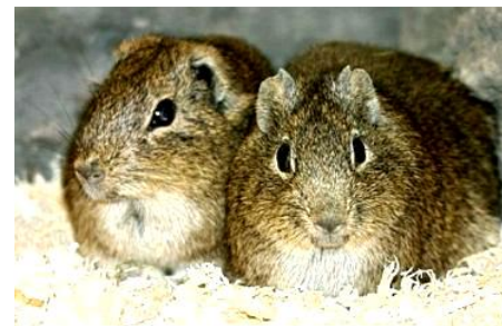
Familie de pârși

Secțiune realizată de Mariela Popovici Sturza - coordonator de activități pentru protecția naturii.