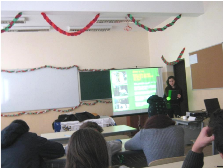
....Liceul MATHIAS HAMMER Anina